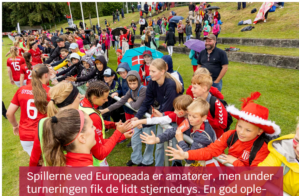
Spillerne ved Europeada er amatører, men under turneringen fik de lidt stjernedrys. En god oplevelse for spillerne og de sydslesvigske unge.