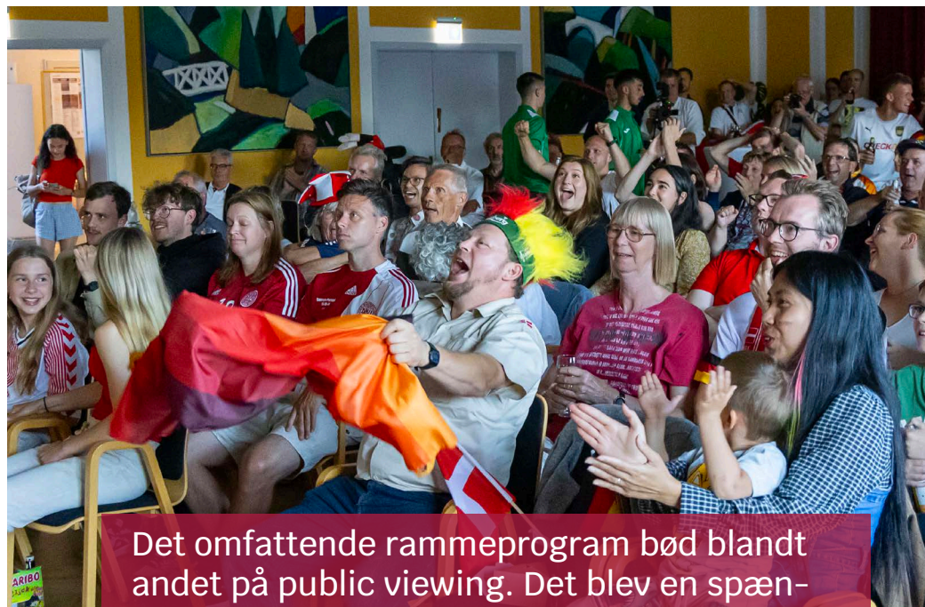
Det omfattende rammeprogram bød blandt andet på public viewing. Det blev en spændende aften, da Danmark mødte Tyskland.