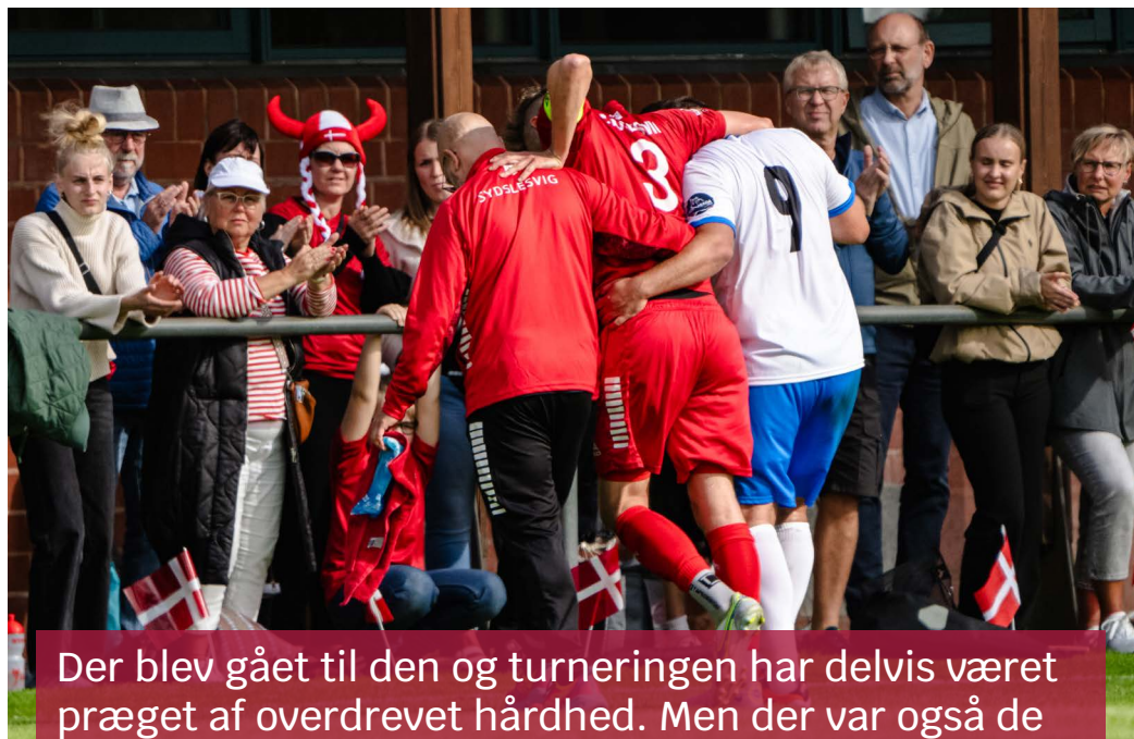
Der blev gået til den og turneringen har delvis været præget af overdrevet hårdhed. Men der var også de andre øjeblikke - hvor modstandere hjalp hinanden.