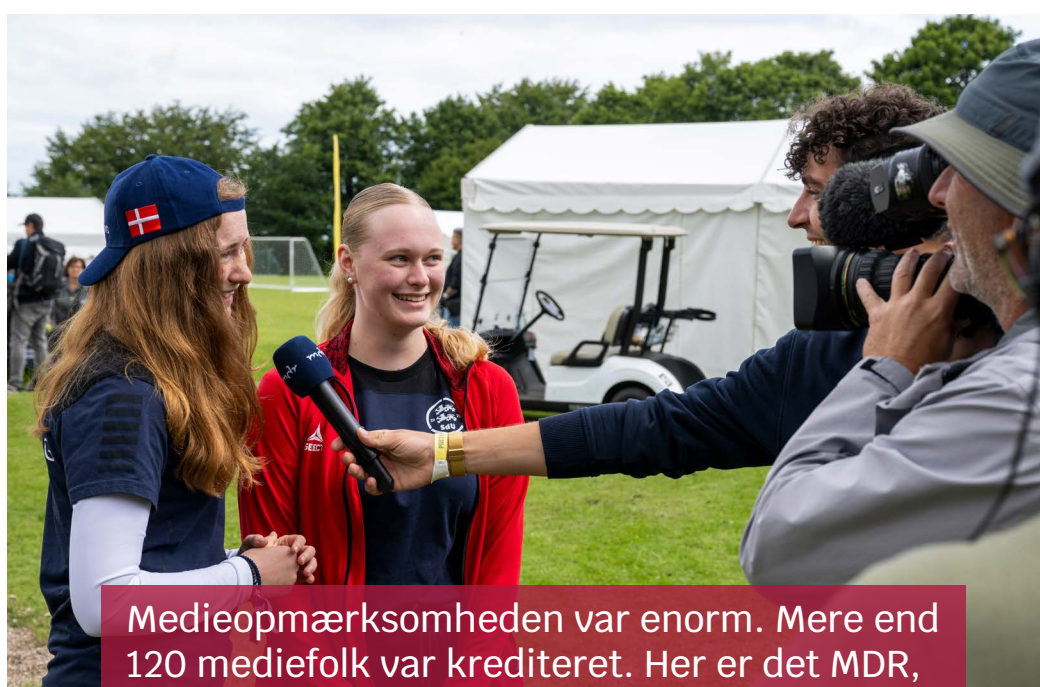
Medieopmærksomheden var enorm. Mere end 120 mediefolk var krediteret. Her er det MDR, der interviewer to sydslesvigske spillere.