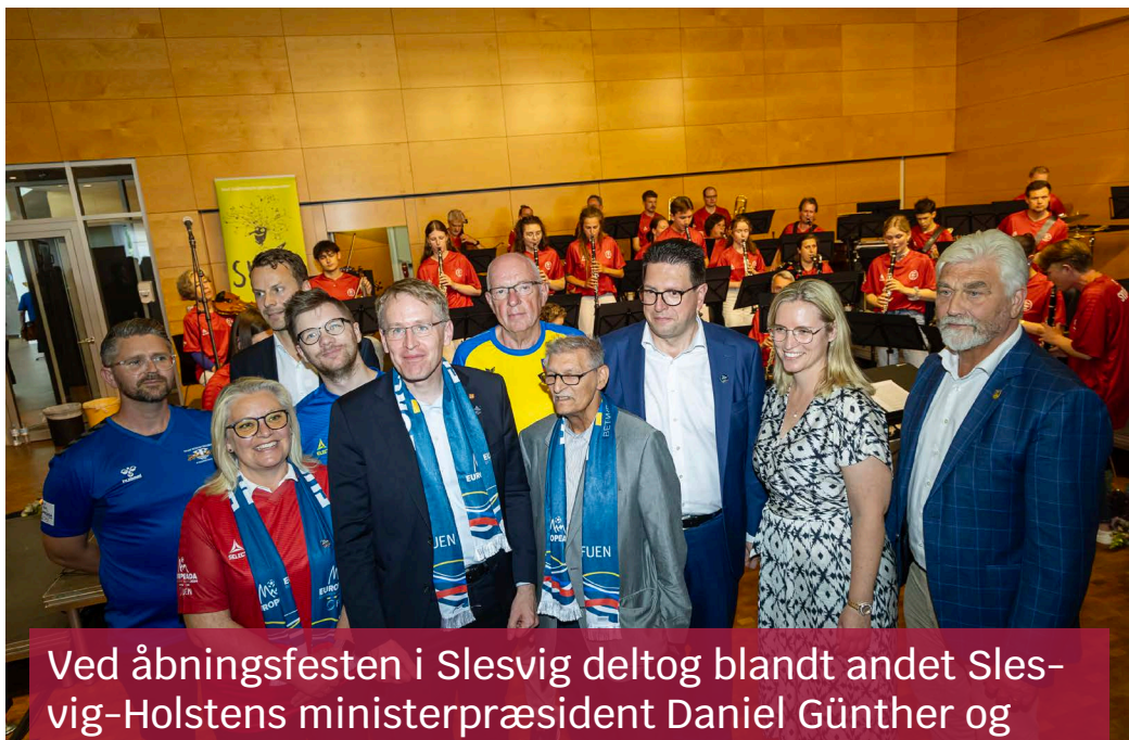
Ved åbningsfesten i Slesvig deltog blandt andet Slesvig-Holstens ministerpræsident Daniel Günther og Danmarks økonomiminister Stephanie Lose.