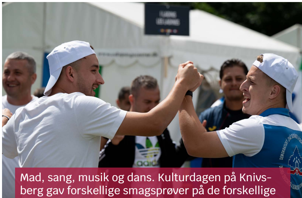
Mad, sang, musik og dans. Kulturdagen på Knivsberg gav forskellige smagsprøver på de forskellige mindretal. Stemningen var god - og vejret holdt.