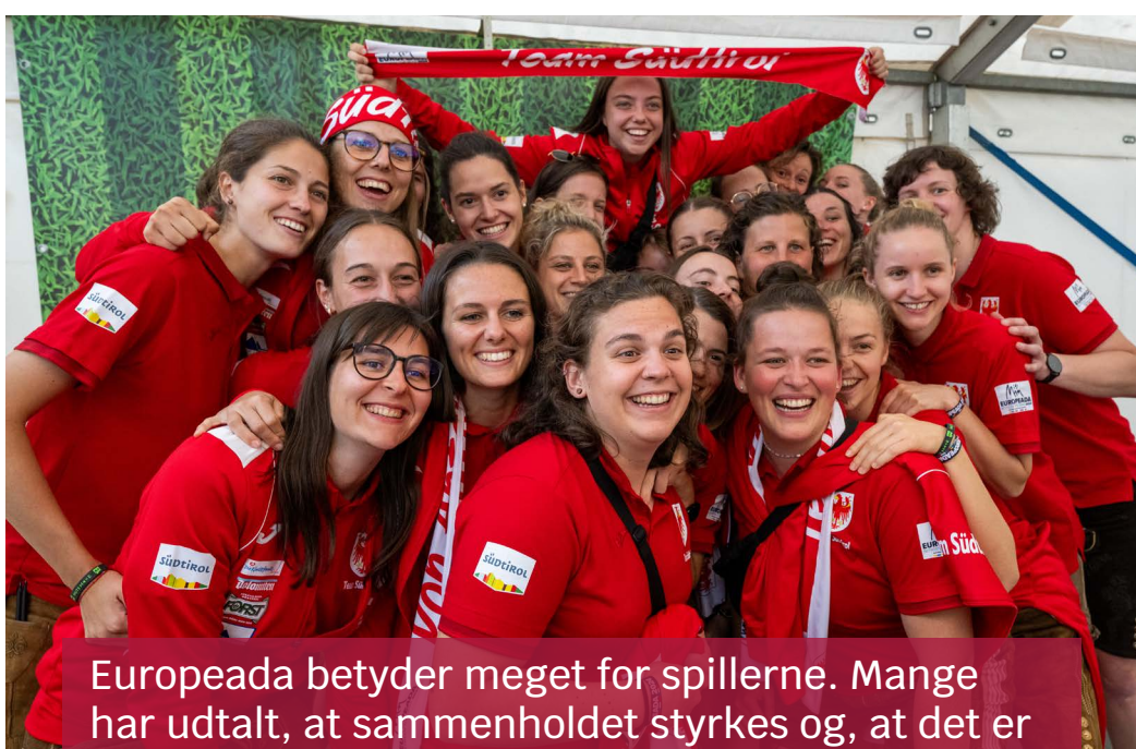
Europeada betyder meget for spillerne. Mange har udtalt, at sammenholdet styrkes og, at det er noget helt unikt at repræsentere deres mindretal.