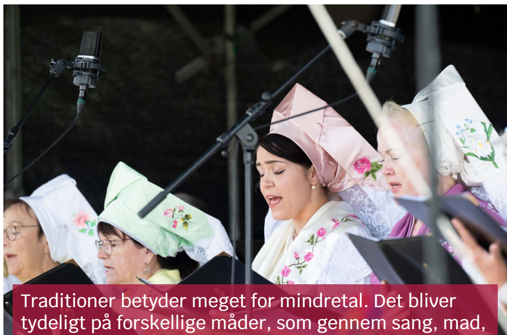
Traditioner betyder meget for mindretal. Det bliver tydeligt på forskellige måder, som gennem sang, mad, festdage og for nogles vedkomne beklædning.