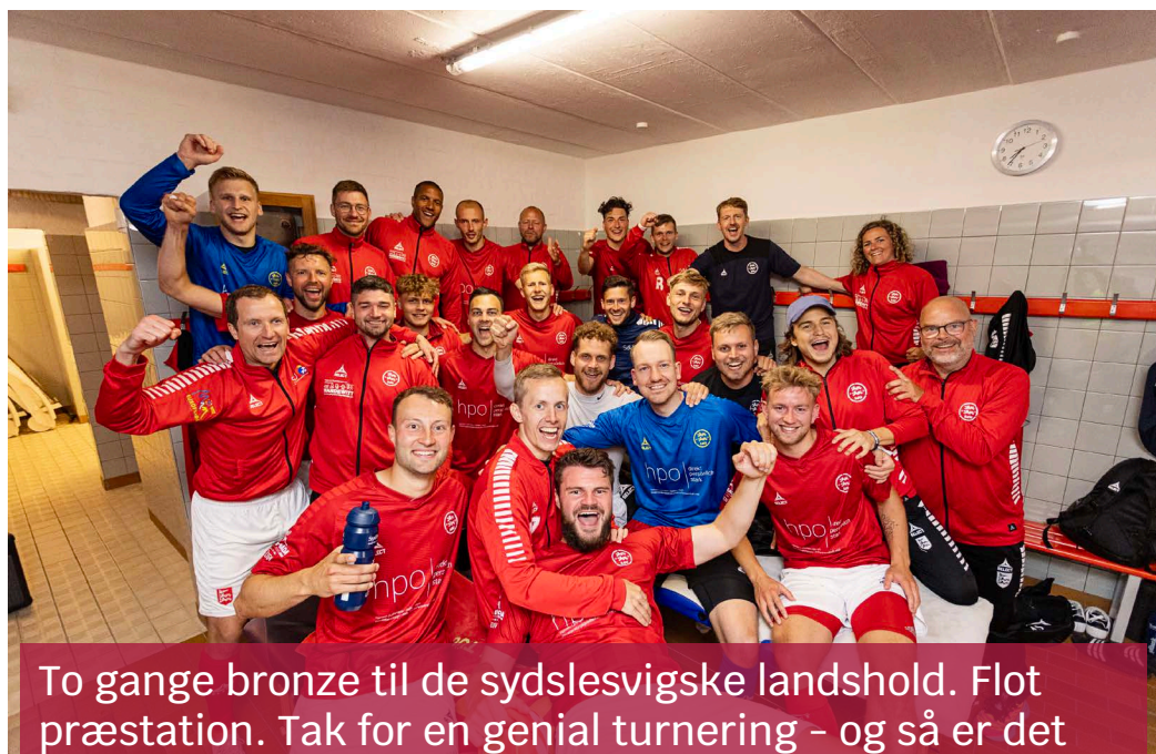
To gange bronze til de sydslesvigske landshold. Flot præstation. Tak for en genial turnering - og så er det vist på tide at vi alle melder os ind i støtteforeningen ;-)