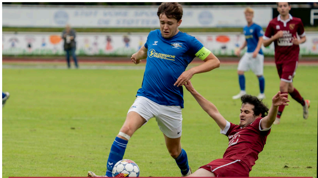
På første kampdag løb Team Nordschleswig „Æ Mannschaft“ ind i Ils Rumantschs, der repræsenterer rætoromanerne fra Schweiz. Kampen endte 0-0.