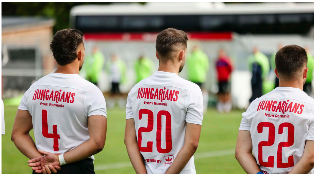
24 mindretal fra 13 lande var repræsenteret. Blandt dem Ungarerne fra Rumænien, der ifølge FUEN er det største nationale mindretal i Europa - der bor i ét land.