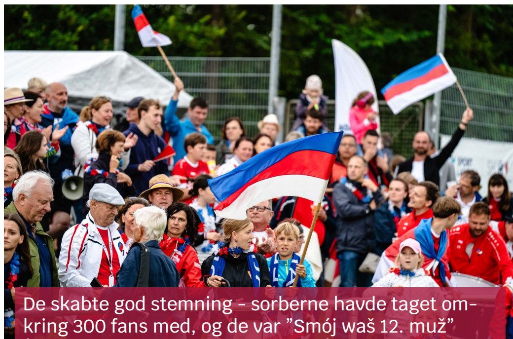
De skabte god stemning - sorberne havde taget omkring 300 fans med, og de var "Smój waš 12. muž" (Obersorbisk "Vi er jeres 12. mand").