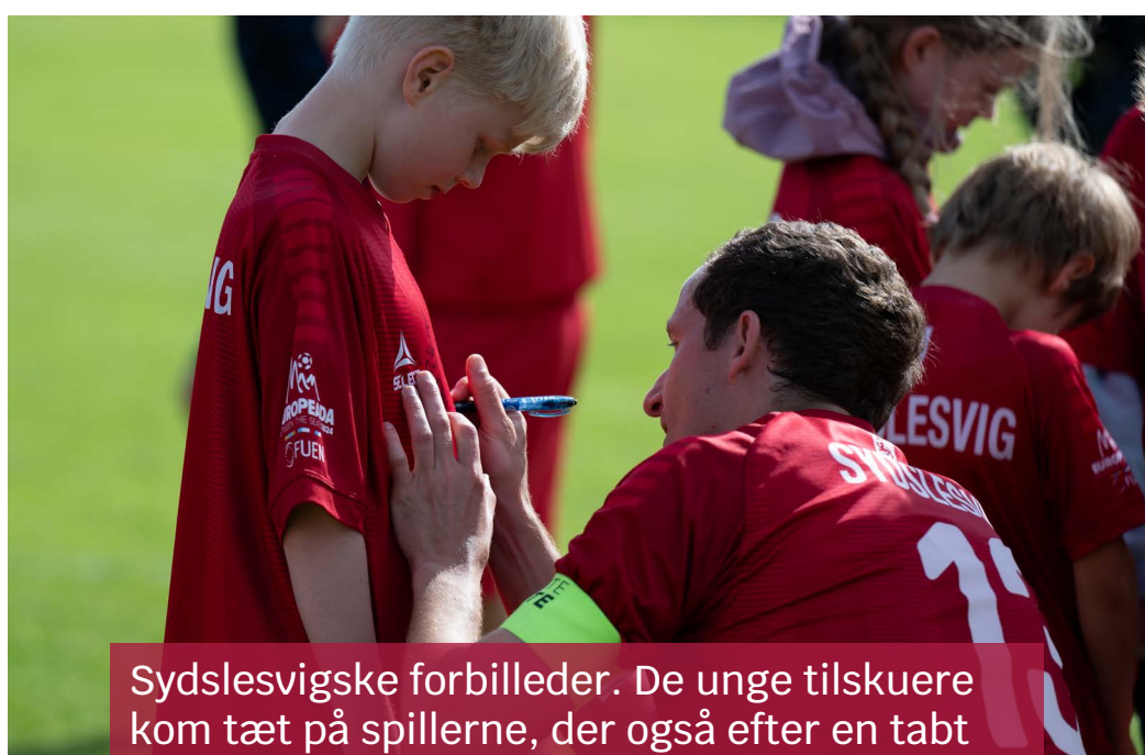
Sydslesvigske forbilleder. De unge tilskuere kom tæt på spillerne, der også efter en tabt semifinal var parate til at give autografer.