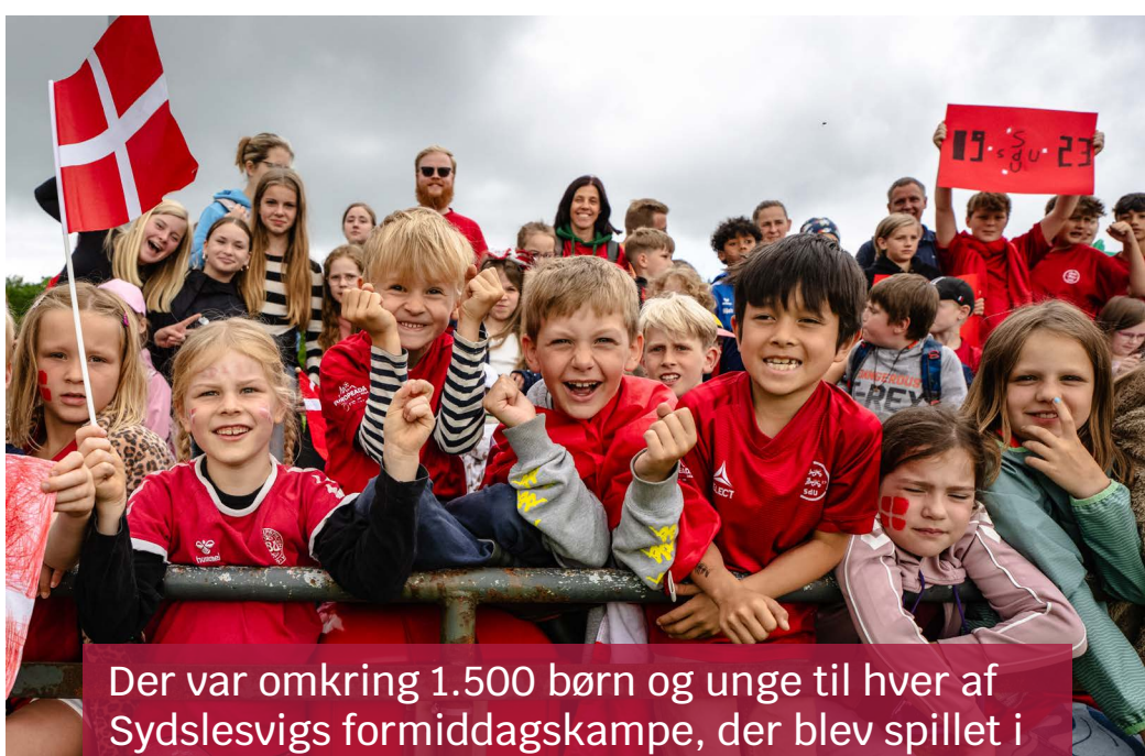
Der var omkring 1.500 børn og unge til hver af Sydslesvigs formiddagskampe, der blev spillet i Flensborg henholdsvis i Slesvig.