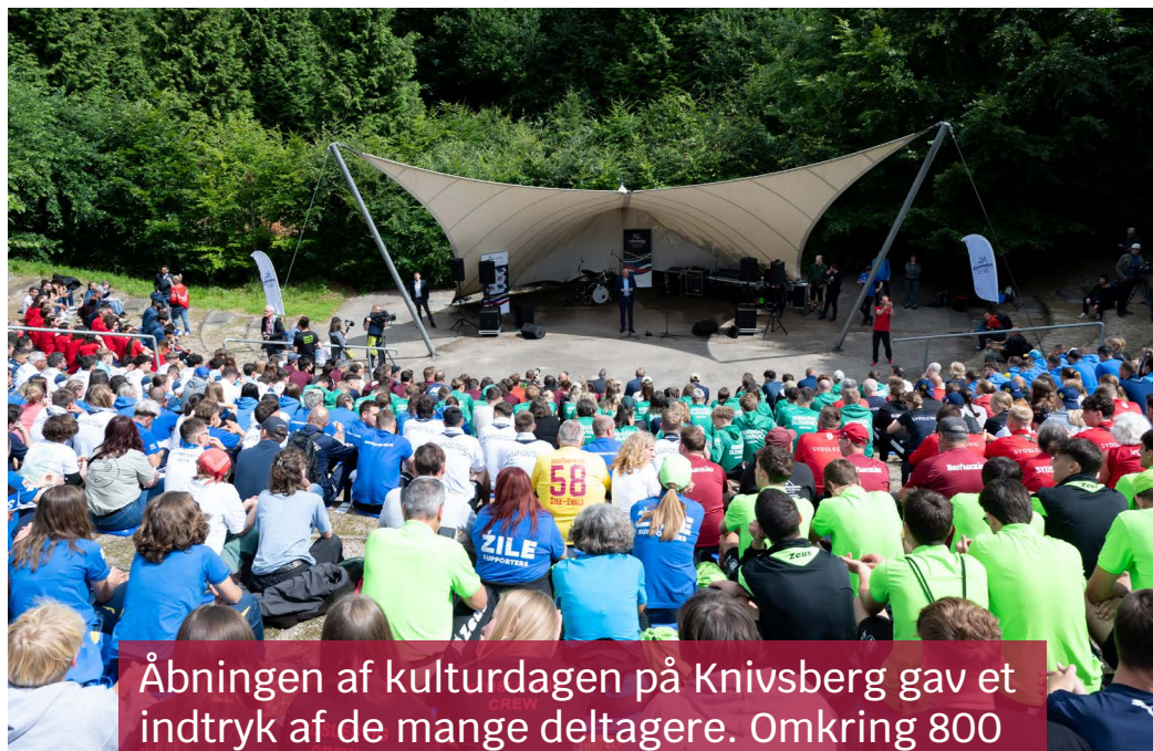
Åbningen af kulturdagen på Knivsberg gav et indtryk af de mange deltagere. Omkring 800 spillere var med til Europeada 2024.