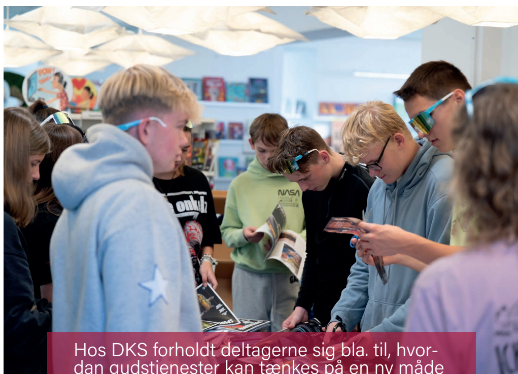
Hos DKS forholdt deltagerne sig bla. til, hvordan gudstjenester kan tænkes på en ny måde