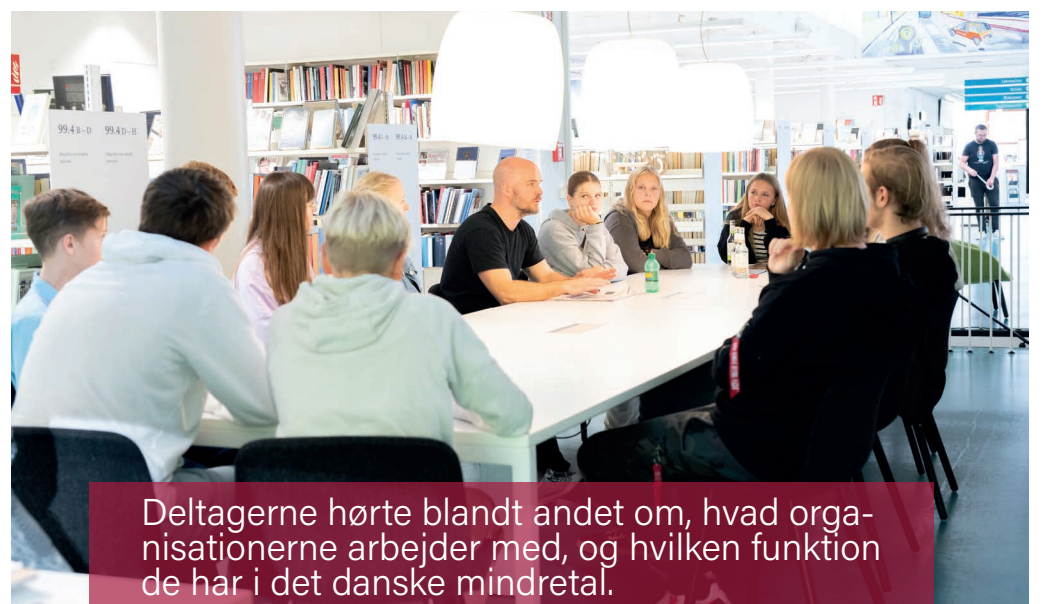
Deltagerne hørte blandt andet om, hvad organisationerne arbejder med, og hvilken funktion de har i det danske mindretal.