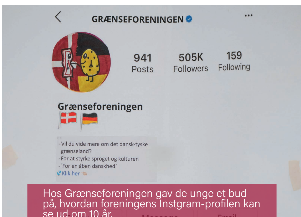
Hos Grænseforeningen gav de unge et bud på, hvordan foreningens Instagram-profilen kan se ud om 10 år.