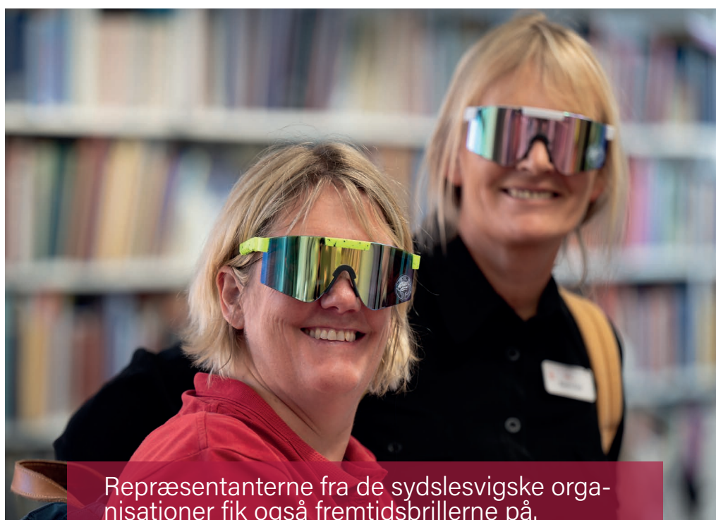
Repræsentanterne fra de sydslesvigske organisationer fik også fremtidsbrillerne på.