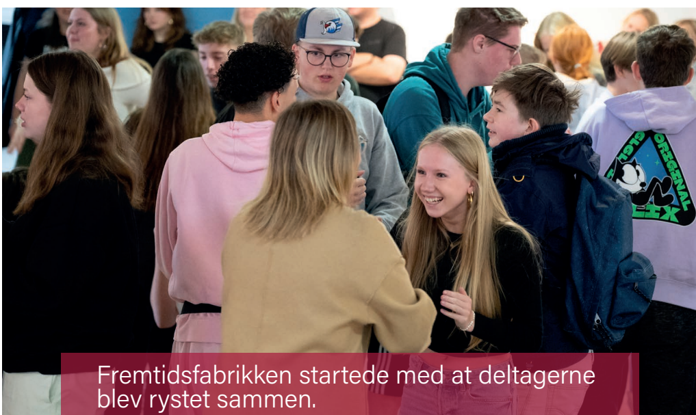
Fremtidsfabrikken startede med at deltagerne blev rystet sammen.

Fremtidsfabrikken Arrangementet blev holdt for fjerde gang. Det er en udløber af Sydslesvigkonferencen, som hørte under Det Sydslesvigske Samråd. Konferencen blev gennemført nogle gange, men mødte kritik, fordi det typisk var "Tordenskjolds soldater", der mødte op til konferencerne. Der kom derfor et forslag om, at gøre konferencen til en ungdomskonference. Ud fra det opstod Fremtidsfabrikken, som SdU står for at gennemføre.