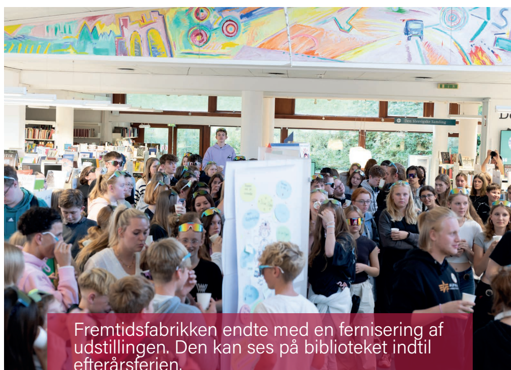
Fremtidsfabrikken endte med en fernisering af udstillingen. Den kan ses på biblioteket indtil efterårserien.