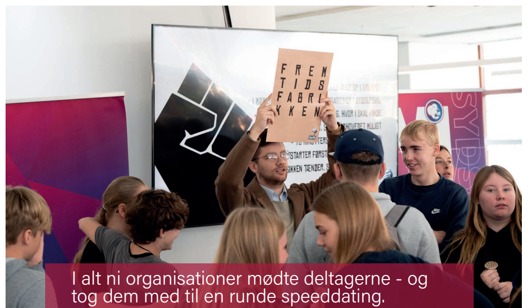
I alt ni organisationer mødte deltagerne - og tog dem med til en runde speeddating.