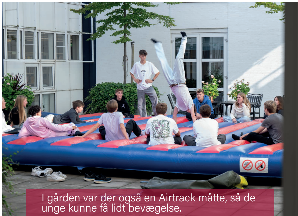
I gården var der også en Airtrack måtte, så de unge kunne få lidt bevægelse.