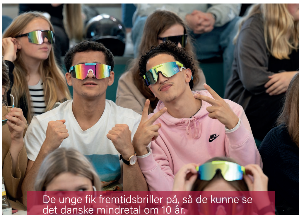
De unge fik fremtidsbriller på, så de kunne se det danske mindretal om 10 år.