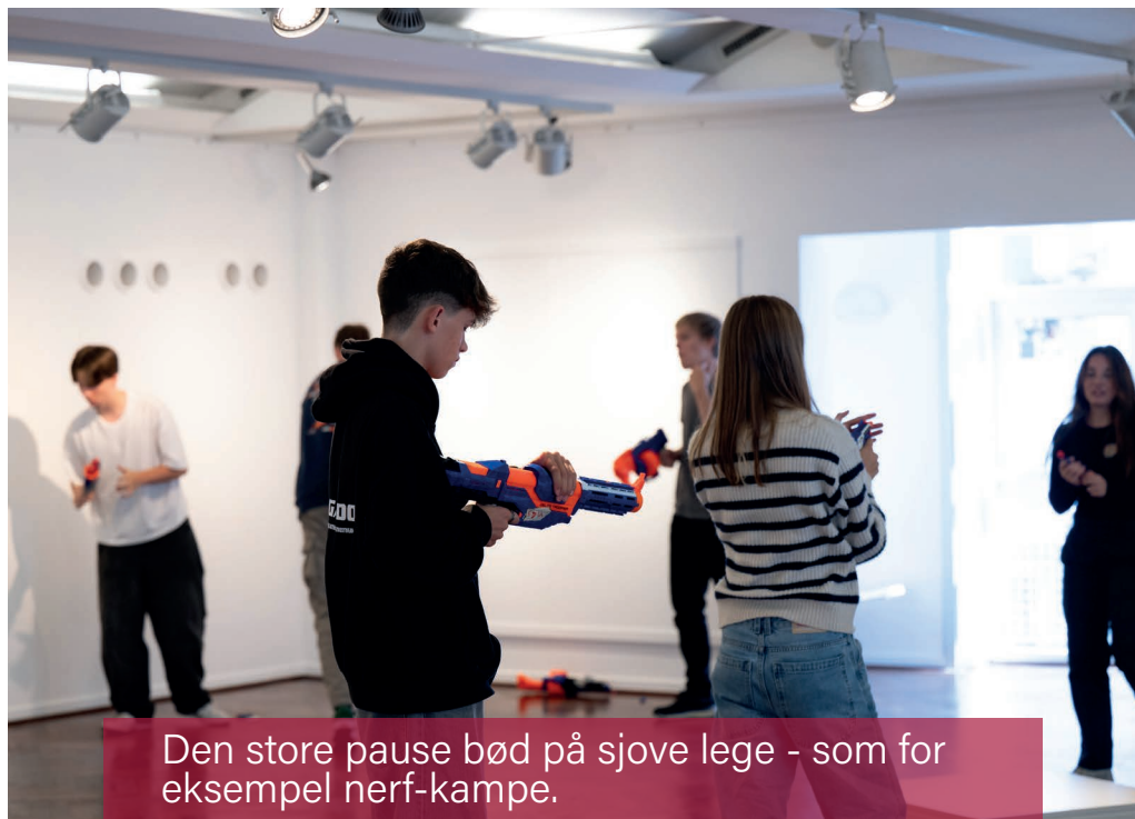
Den store pause bød på sjove lege - som for eksempel nerf-kampe.