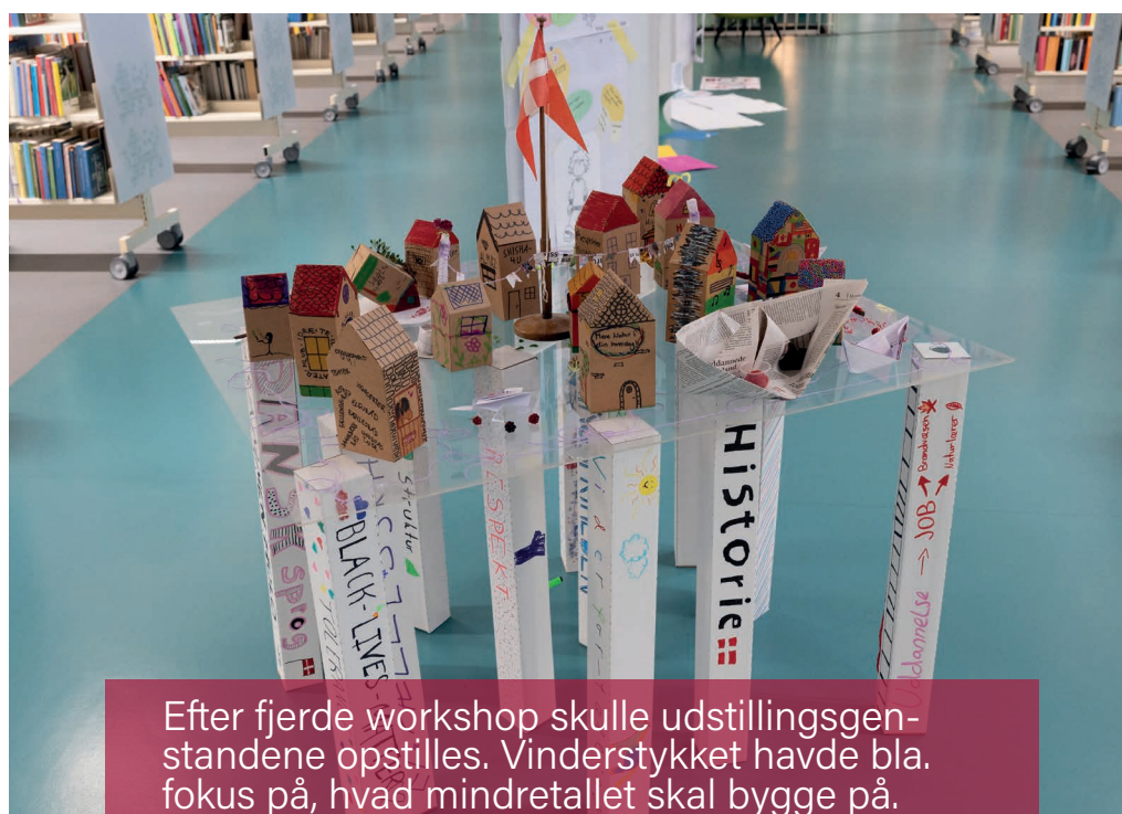
Efter fjerde workshop skulle udstillingsgenstandene opstilles. Vinderstykket havde bla. fokus på, hvad mindretallet skal bygge på.