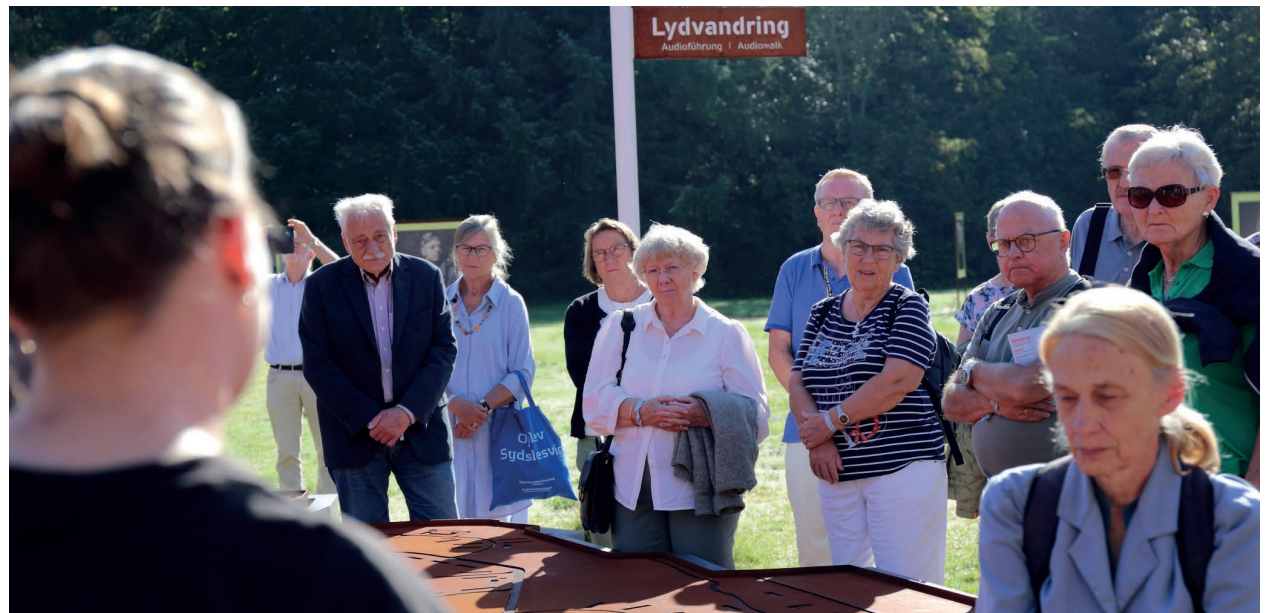
Lydvandring Audiotourning | Audioguide

både angående fortiden, hvor Sydslesvig og Danmark mod- tog rigtig mange af flygtningene fra Østtyskland, og nutiden ved at høre om sydslesvigske børns glæde og fornøjelse ved at komme på lejrskole i Danmark.