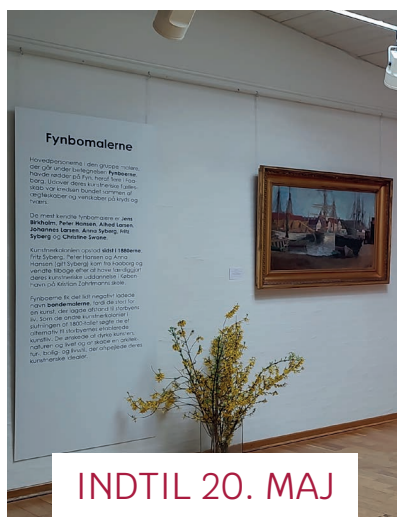
INDTIL 20. MAJ