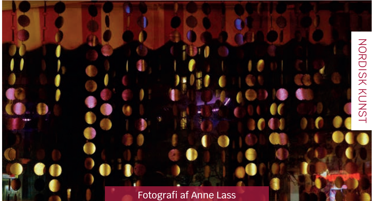
Fotografi af Anne Lass