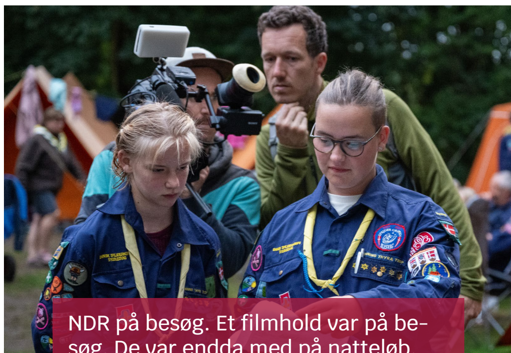
NDR på besøg. Et filmhold var på besøg. De var endda med på natteløb.