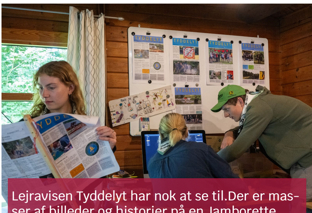
Lejravisen Tyddelyt har nok at se til. Der er masser af billeder og historier på en Jamborette.