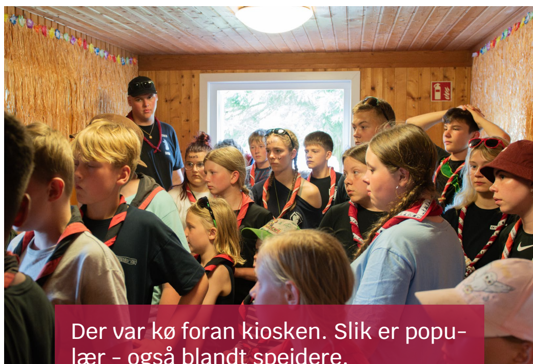
Der var kø foran kiosken. Slik er populær – også blandt spejdere.