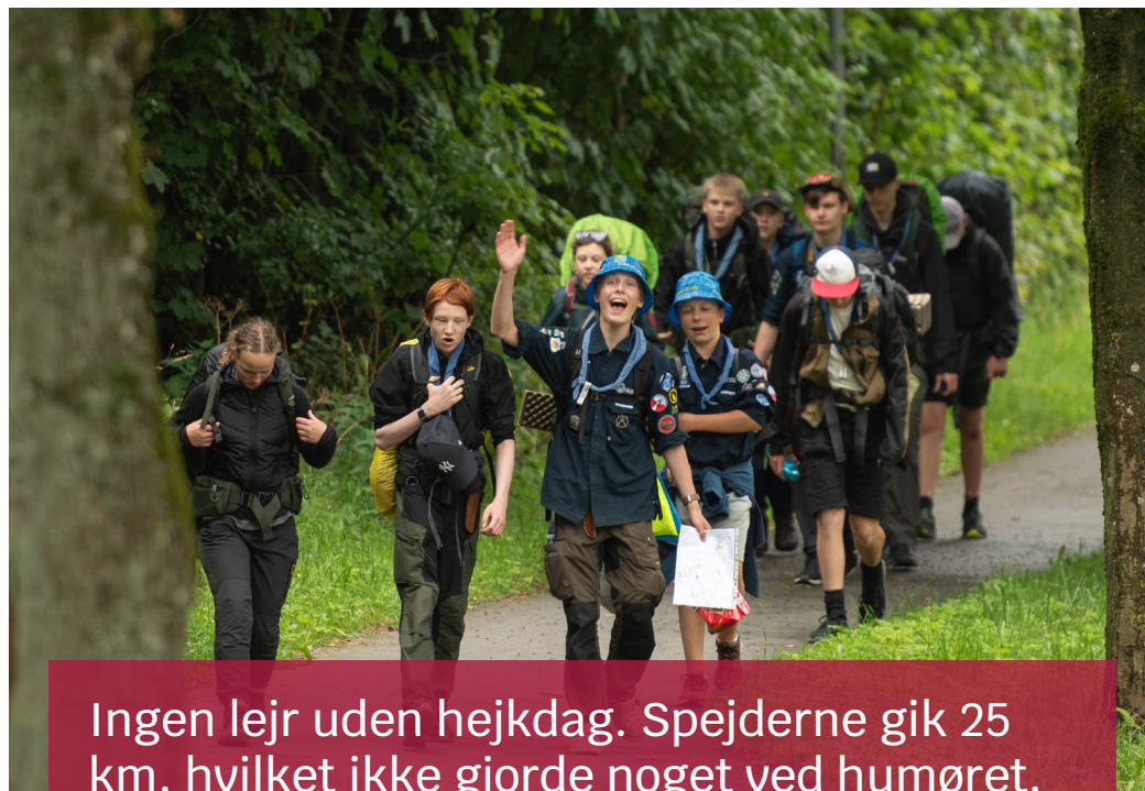
Ingen lejr uden hejkdag. Spejderne gik 25 km, hvilket ikke gjorde noget ved humøret.