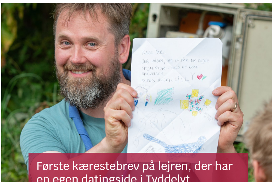
Første kærestebrev på lejren, der har en egen datingside i Tyddelyt.