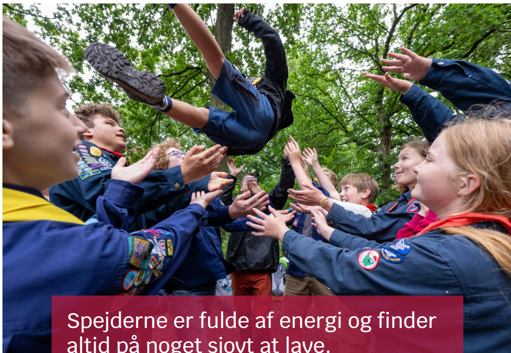
Spejderne er fulde af energi og finder altid på noget sjovt at lave.