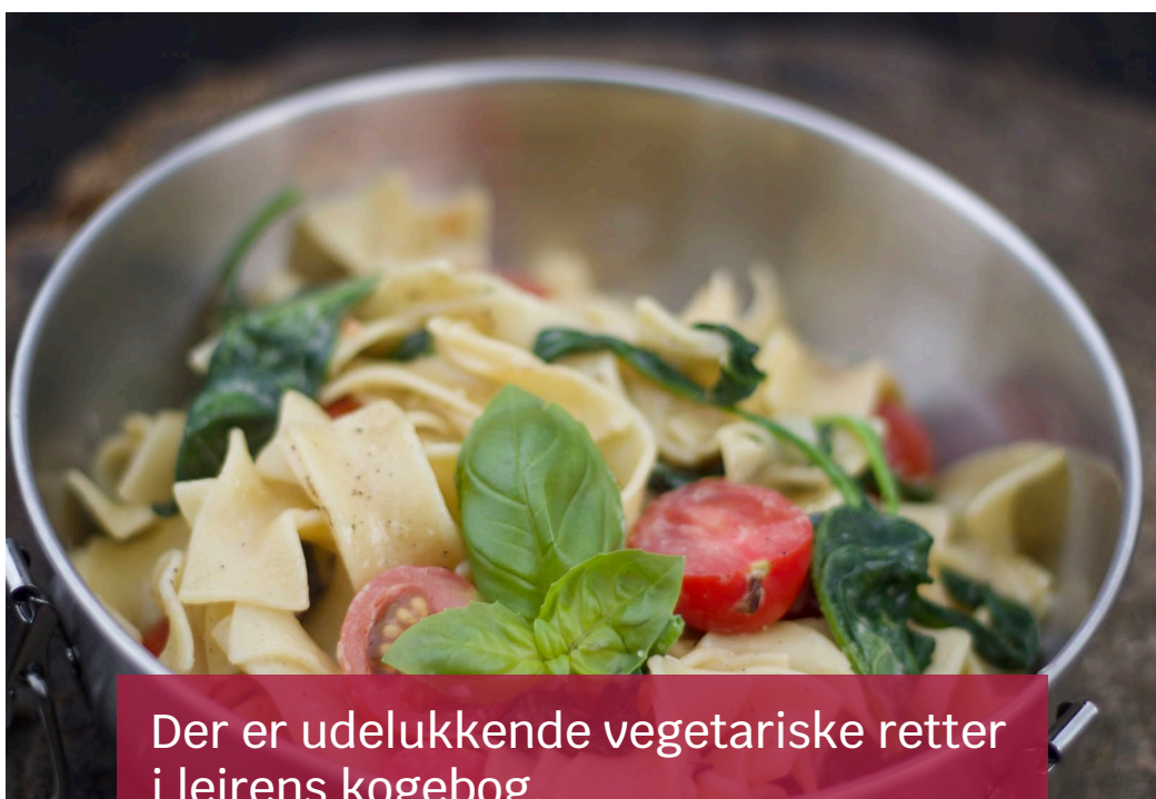
Der er udelukkende vegetariske retter i lejrens kokebog.