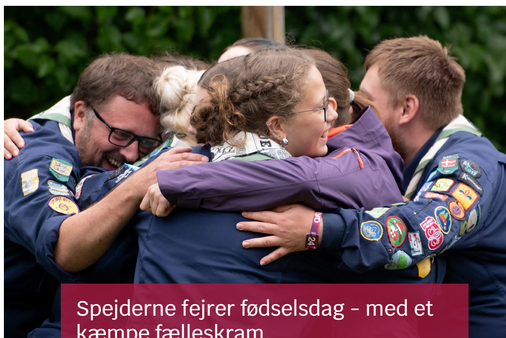
Spejderne fejrer fødselsdag – med et kæmpe fælleskramp.