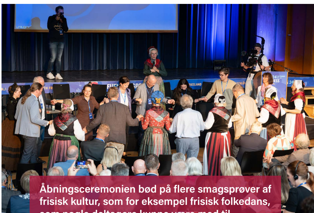
Åbningsceremonien bød på flere smagsprøver af frisisk kultur, som for eksempel frisisk folkedans, som nogle deltagere kunne være med til.