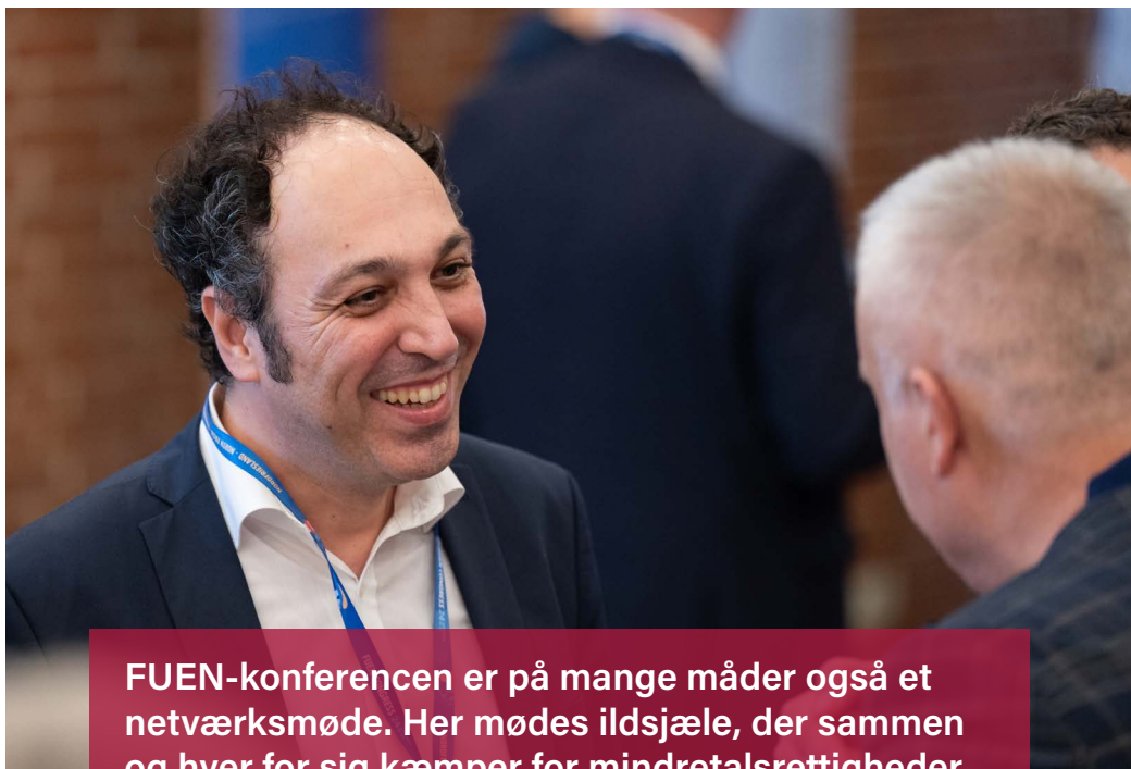
FUEN-konferencen er på mange måder også et netværksmøde. Her mødes ildsjæle, der sammen og hver for sig kæmper for mindretalsrettigheder.