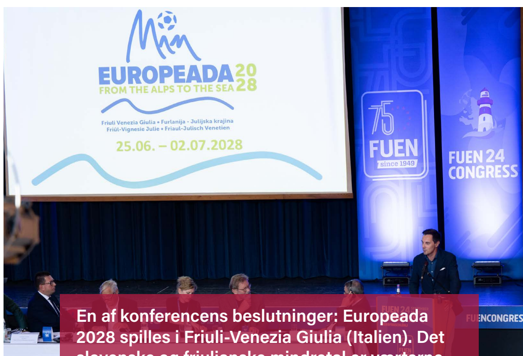
En af konferencens beslutninger: Europeada 2028 spilles i Friuli-Venezia Giulia (Italien). Det slovenske og friulianske mindretal er værterne.