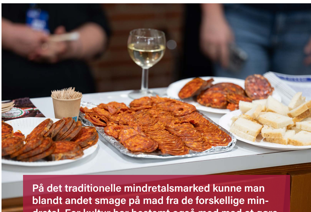
På det traditionelle mindretalsmarked kunne man blandt andet smage på mad fra de forskellige mindretal. For kultur har bestemt også med mad at gøre.