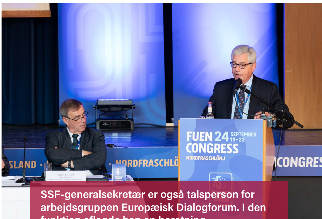
SSF-generalsekretær er også talsperson for arbejdsgruppen Europæisk Dialogforum. I den funktion aflagde han en beretning.