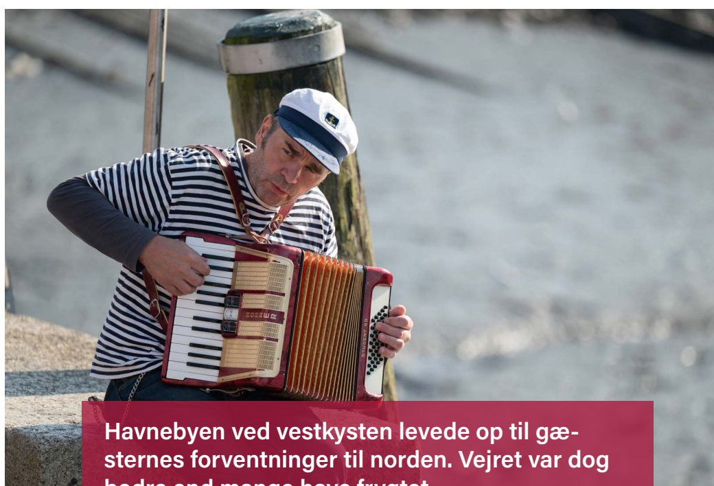
Havnebyen ved vestkysten levede op til gæsternes forventninger til norden. Vejret var dog bedre end mange have frygtet.