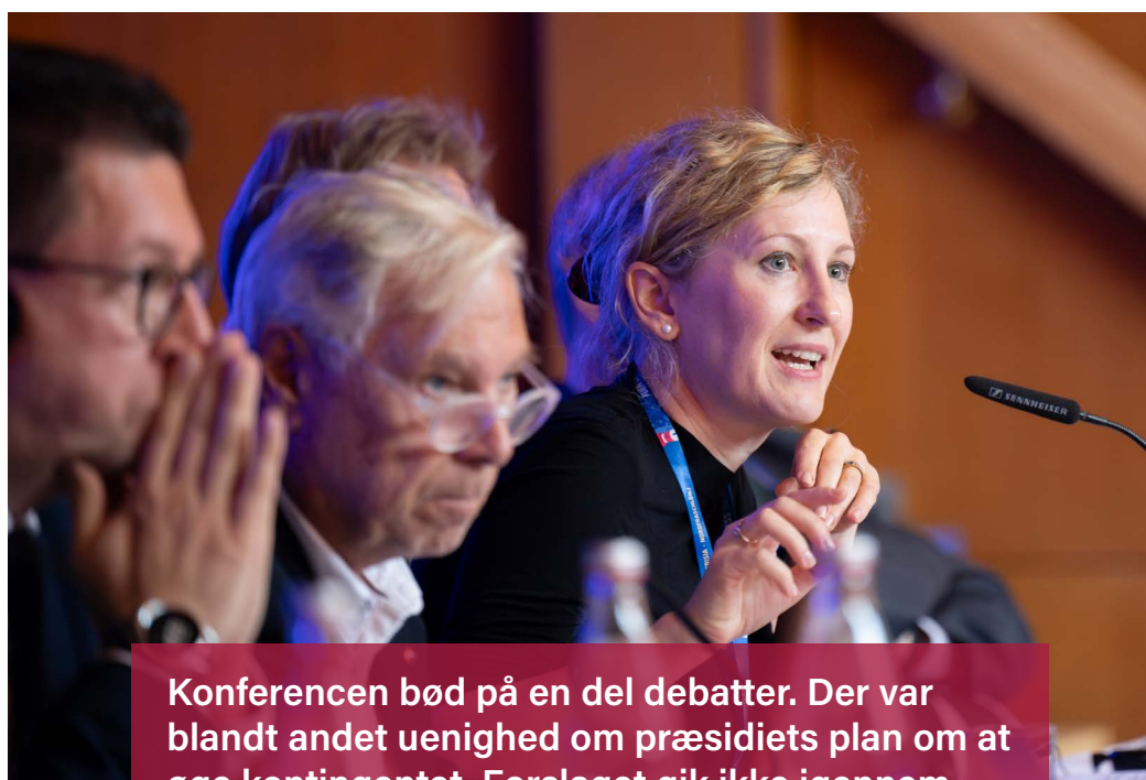
Konferencen bød på en del debatter. Der var blandt andet uenighed om præsidiets plan om at øge kontingentet. Forslaget gik ikke igennem.