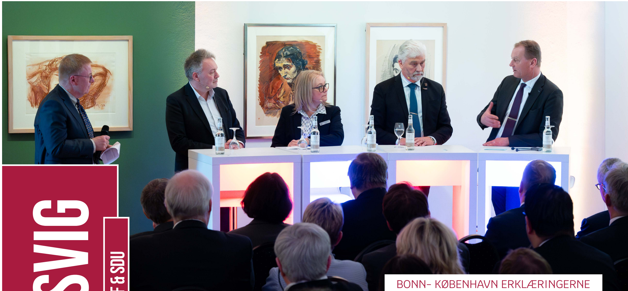
BONN- KØBENHAVN ERKLÆRINGERNE