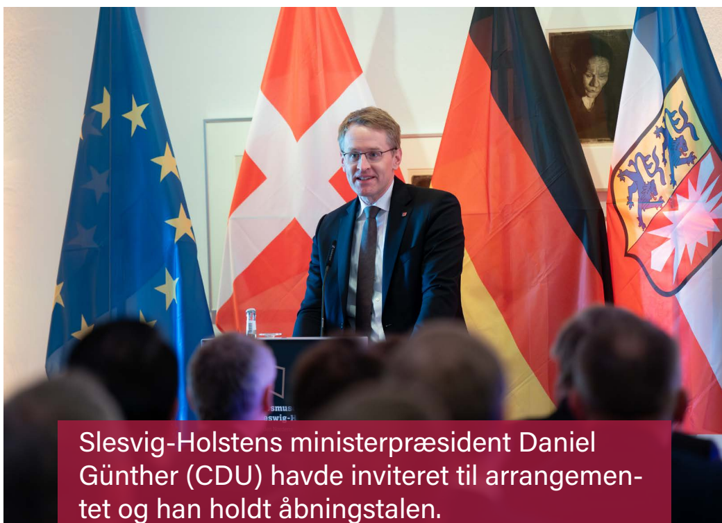
Slesvig-Holstens ministerpræsident Daniel Günther (CDU) havde inviteret til arrangementet og han holdt åbningstalen.