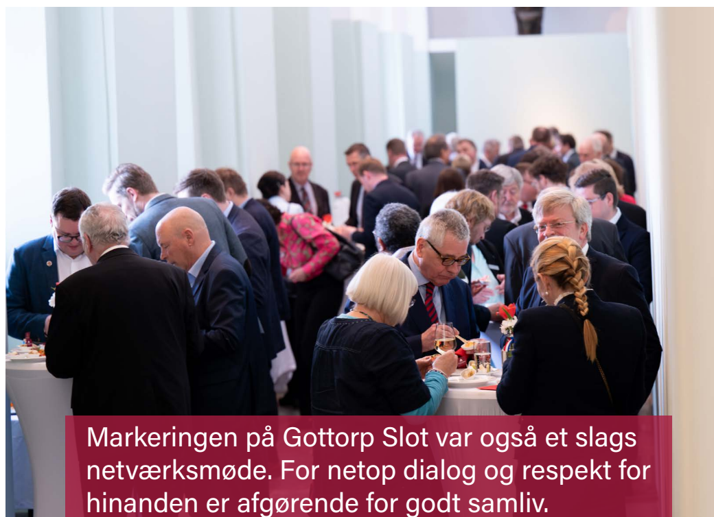
Markeringen på Gottorp Slot var også et slags netværksmøde. For netop dialog og respekt for hinanden er afgørende for godt samliv.