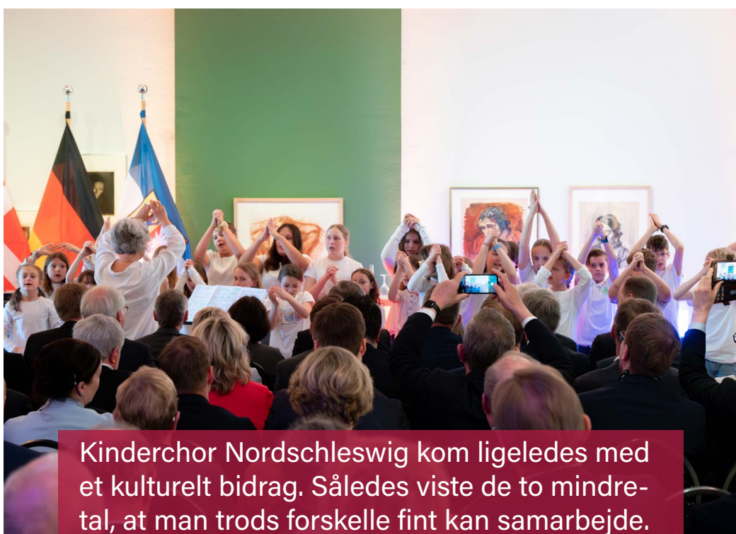
Kinderchor Nordschleswig kom ligeledes med et kulturelt bidrag. Således viste de to mindretal, at man trods forskelle fint kan samarbejde.