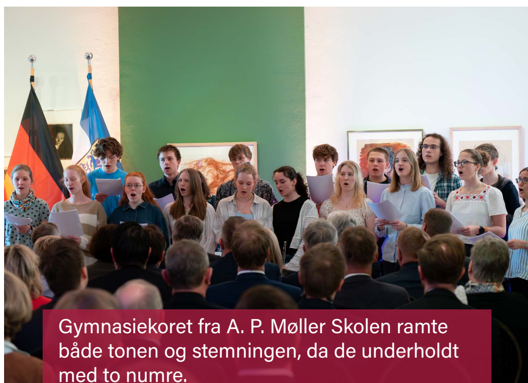
Gymnasiekoret fra A. P. Møller Skolen ramte både tonen og stemningen, da de underholdt med to numre.