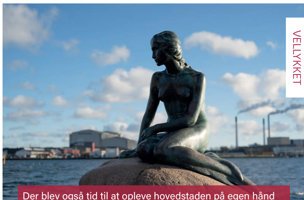
Der blev også tid til at opleve hovedstaden på egen hånd