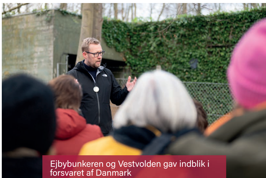
Ejbybunkeren og Vestvolden gav indblik i forsvaret af Danmark