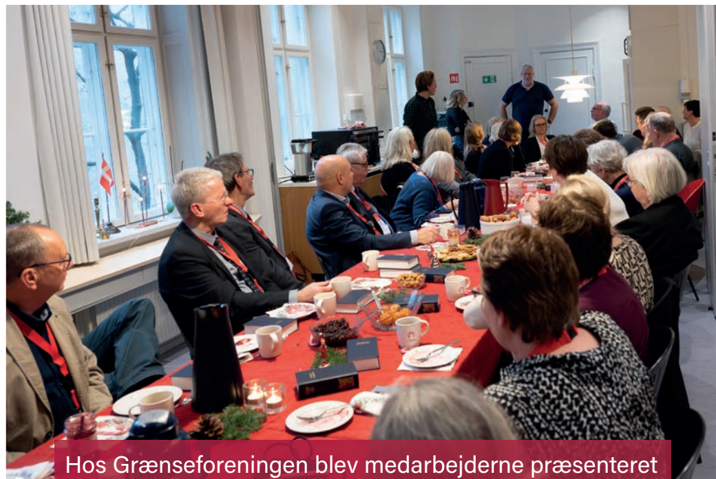
Hos Grænseforeningen blev medarbejderne præsenteret