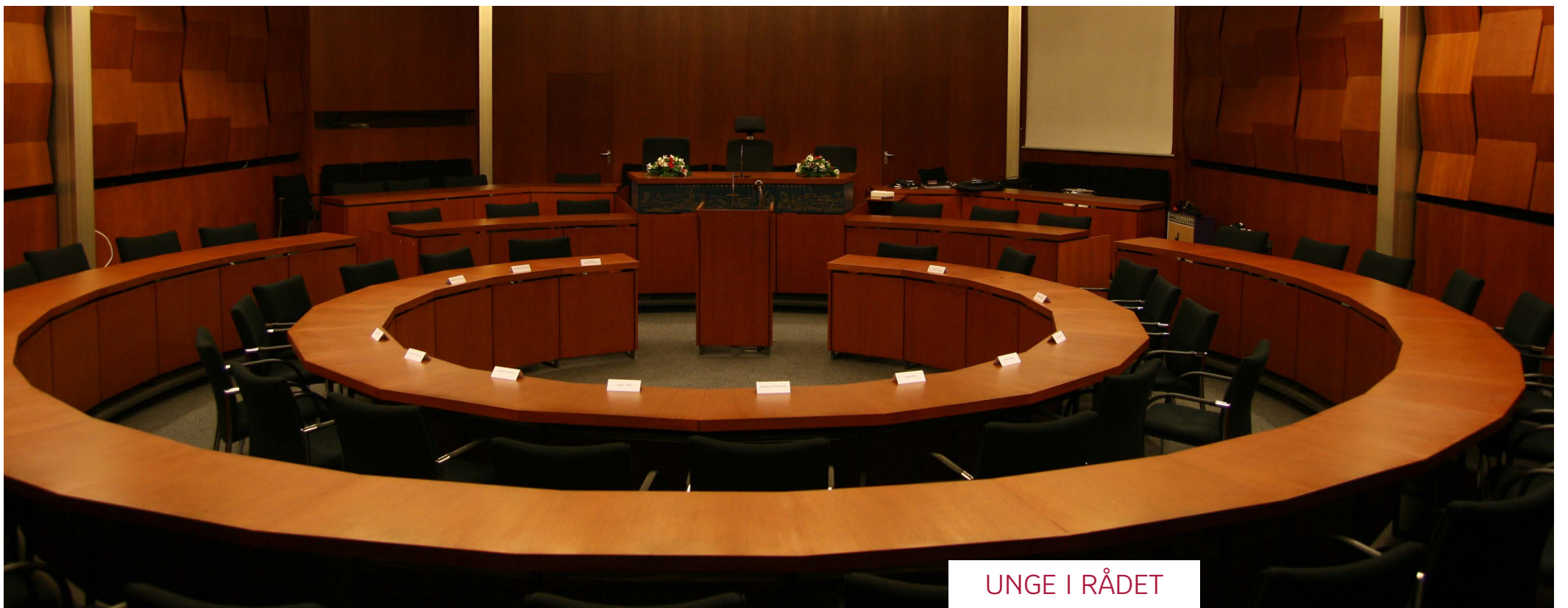
UNGE I RÅDET

Flensborgs unge får nu mulighed for at opleve det politiske arbejde på tættest hold. Den 12. og 13. februar inviterer Flensborg Rådhus elever fra 8.-10. årsgang til at deltage i en simulering af byrådsarbejdet. Her får de unge chancen for at træde ind i rollen som byrådsmedlemmer og arbejde med lokalpolitiske emner i praksis.