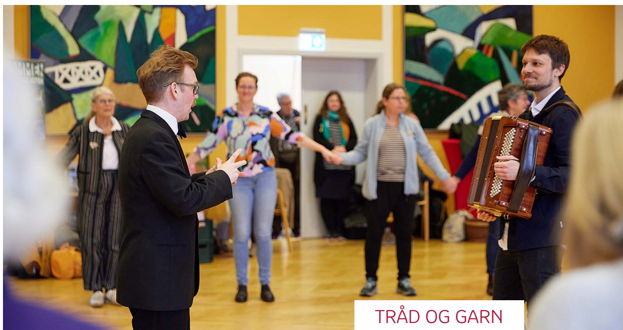
TRÅD OG GARN