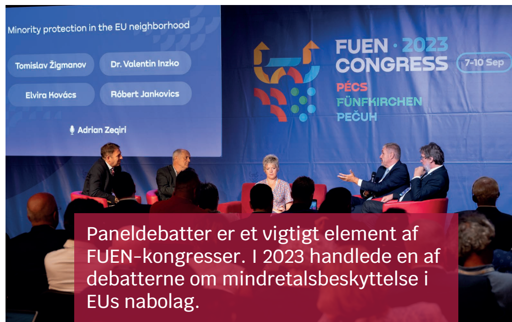
Paneldebatter er et vigtigt element af FUEN-kongresser. I 2023 handlede en af debatterne om mindretalsbeskyttelse i EUs nabolag.