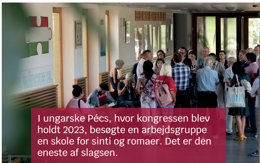
I ungarske Pécs, hvor kongressen blev holdt 2023, besøgte en arbejdsgruppe en skole for sinti og romaer. Det er den eneste af slagsen.

Autoktone mindretal er betegnelsen for nationale mindretal af folk, der er historisk hjemmehørende i et land eller på en egn, modsat alloktone, der er tilvandret.