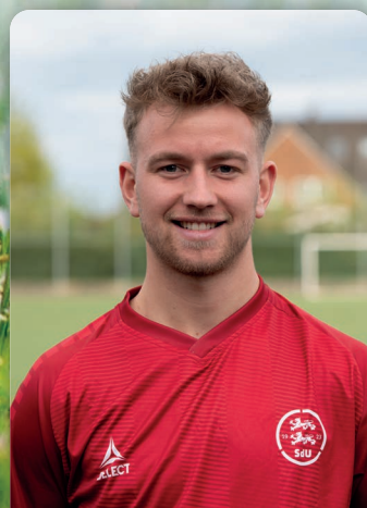
Take Gniosdorz Midtbane SG Nordau