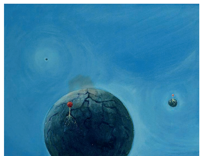
(Karl Andresen: Kloden, oliemaleri)