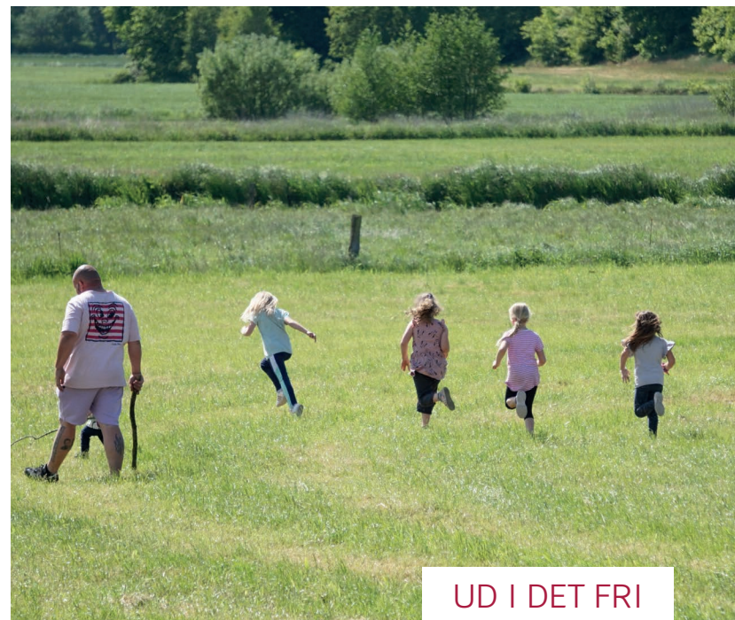
UD I DET FRI