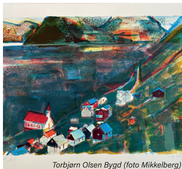
Torbjørn Olsen Bygd

Sidste dag for NORDISK DRAMA er fredag d. 15.9. kl. 13-17. Øvrige åbningstider: tirsdag-onsdag 10-13, torsdag 11-16, fredag - søndag 13-17.