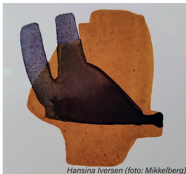
Hansina Iversen