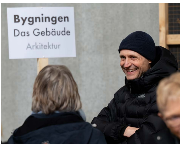
Bygningen Das Gebäude Arkitektur

Forbundspræsident Frank-Walter Steinmeier har tidligere mødt mindretallene. For eksempel, da han i 2017 besøgte Flensborg. Dengang holdt han møde med repræsentanter fra mindretalsunionen FUEN og Dialog-Forum Norden. Repræsentanter fra det danske mindretal deltog også. Samtidig har forbundspræsidenten tætte bånd til Danmark. I 2021 - i forbindelse med det forsinkede 1920-jubilæum - besøgte han Syddanmark. Her deltog han blandt andet i en ceremoni ved skansen på Dybbøl. Han mødte Dronning Margrethe II og statsminister Mette Frederiksen. I 2024 besøgte Danmarks Kongepar Frederik X. og Mary Kongeparpræsidenten. Efter besøget i Berlin, tog Kongeparret videre til grænselandet, hvor de var på Danevirke og på Flensborghus.